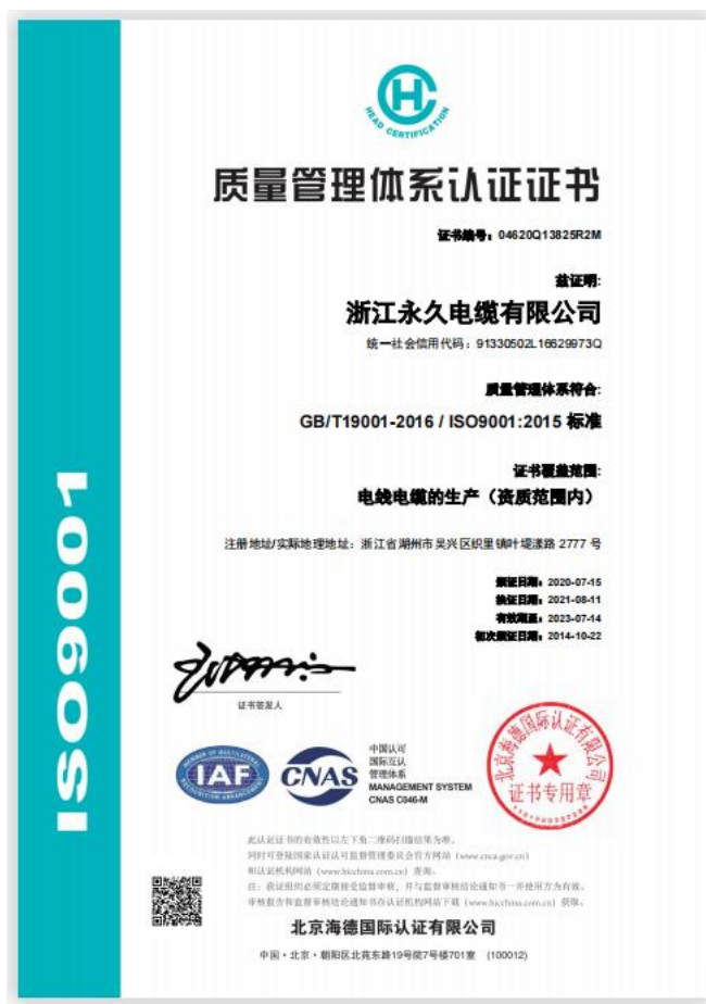
图 5 质量、环境、职业健康安全体系认证证书