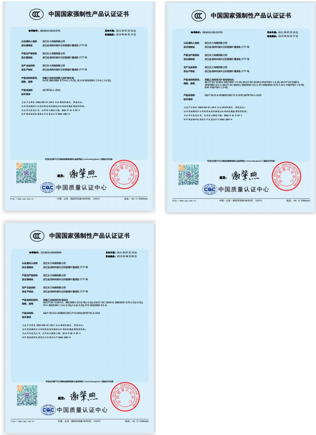
图表 8 产品认证证书